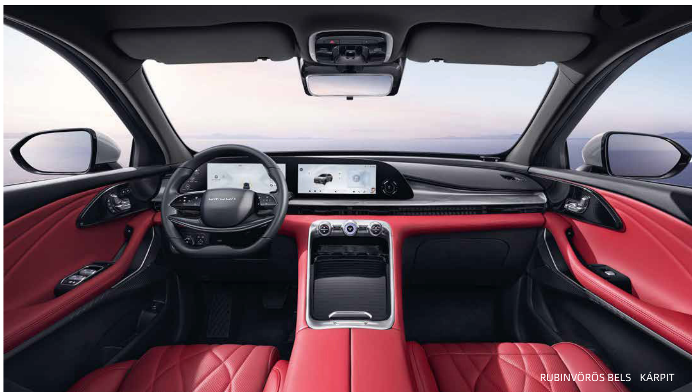
RUBINVÖRÖS BELSŐ KÁRPIT