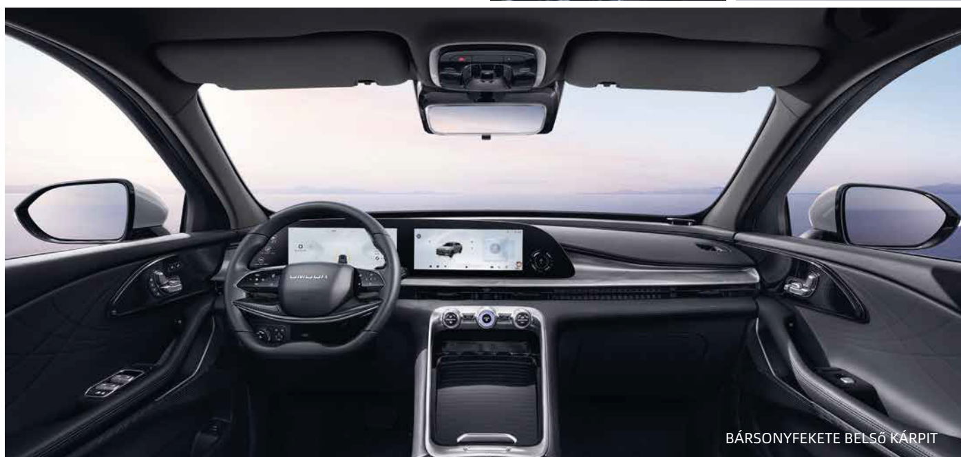
BÁRSONYFEKETE BELSŐ KÁRPIT

A Genius Automotive Europe Kft. a mindenkori változtatás jogát, illetve az előzetes bejelentés nélküli műszaki adatok és felszereltségi tartalmak módosításának jogát is fenntartja. Az általunk forgalmazott összes OMODA modellre teljes körű általános, gyári műszaki garanciát vállalunk 7 év vagy 150.000 km futásteljesítményig, céges ügyfeleknek egyaránt. A pontos részletekért kérjük forduljon hivatalos O&J márkakereskedőjéhez vagy érdeklődjön a www.omodahungary.com weboldalon.