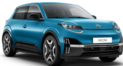
Boldogságnék RCN – 160 000 Ft