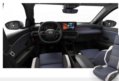
Sport belső Szintetikus bőr ülések