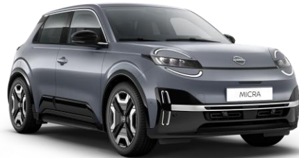
Elegánszüst* KQG – 160 000 Ft