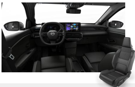
Komfort belső Szövet ülések