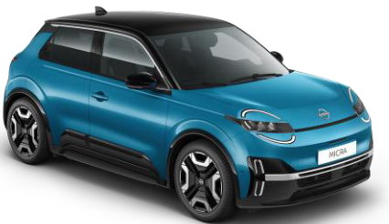
Boldogságnék / Fekete tető YZF – 300 000 Ft