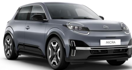
Elegánszüst* KQG – 160 000 Ft