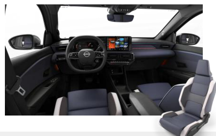
Sport belső – Szintetikus bőr ülések