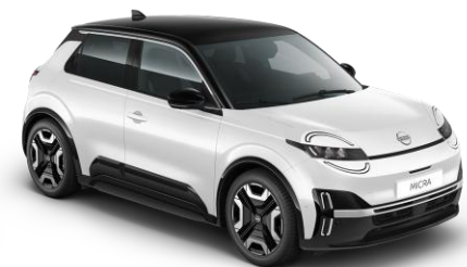
Hófehér / Fekete tető XUF – 300 000 Ft