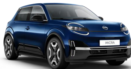
Tengerészkék RRE – 160 000 Ft