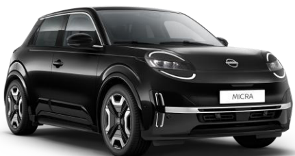
Misztikusfekete* GNE – 160 000 Ft