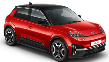
Lázadóvörös / Fekete tető YZA – 300 000 Ft