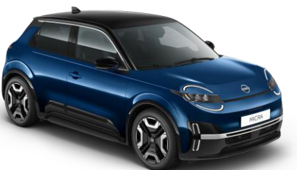
Tengerészkék / Fekete tető YWW – 300 000 Ft