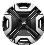
18" Iconic könnyűfém keréktárcsa