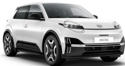
Hófehér* 369 – 0 Ft