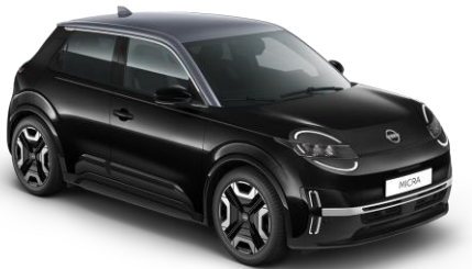
Misztikusfekete / Szürke tető YWX – 300 000 Ft