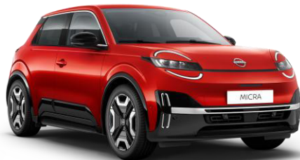
Lázadóvörös NPT – 160 000 Ft