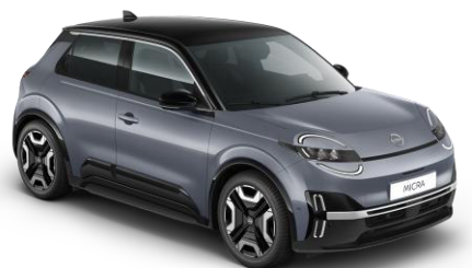
Elegánszüst / Fekete tető YUY – 300 000 Ft