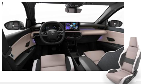
Zen belső – Szövet és szintetikus bőr ülések