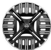
18" Acél keréktárcsa dísz tárcsával