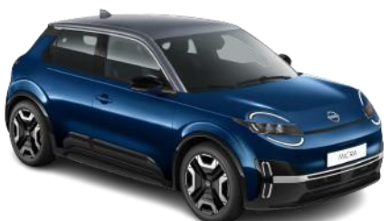
Tengerészkék / Szürke tető YWZ – 300 000 Ft

*ENGAGE felszereltség a csillaggal megjelölt színekben érhető el.