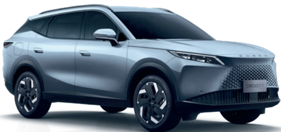
HOLDFÉNY EZÜST (KU)