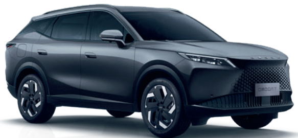
MATT KOZMOSZSZÜRKE (UK)