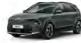
Cityscape Green (CGE)