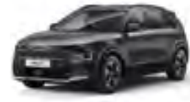
Interstellar Gray (AGT)