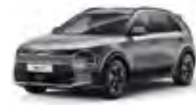
Steel Gray (KLG)