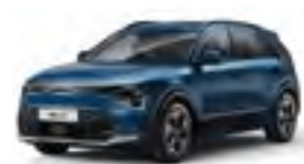
Mineral Blue (M4B)